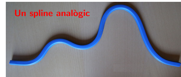
Interpolació per splines 5/27