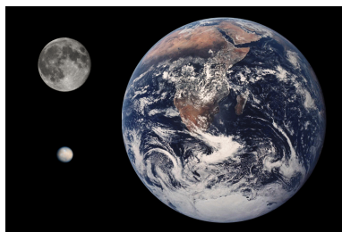
La Terra, la Lluna i Ceres

Hi ha moltes coses a dir, en primer lloc, Gauss és lliure de fer-ho, un teorema és cert si la conclusió es dedueix correctament de les hipòtesis, i crec que tothom pot veure que realment és així. No hi ha doncs res il·lògic ni arguments circulars.