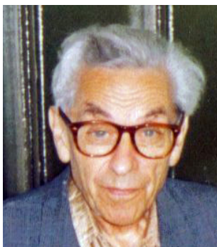
P. Erdős (1913–1996)

és un número normal en base 10. Dos anys més tard Besicovitch va demostrar que, si canviem la successió de números naturals per la dels seus quadrats, el número resultant continua sent normal en base 10. És a dir 0,149162536\dots és normal en base 10.