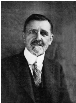
E. Borel (1871-1956)

Trobareu tot seguit una petita ressenya biogràfica de E. Borel i, si en voleu saber més, podeu llegir l'article [Co] on es pot trobar molta més informació.